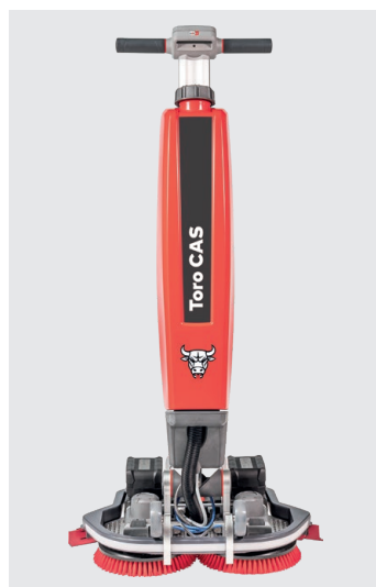
Cleanfix Toro CAS en position de travail