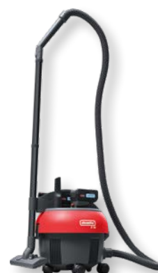
S10 Plus CAS