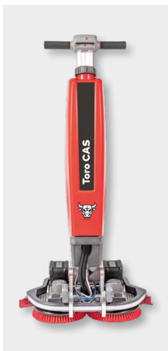
Cleanfix Toro CAS en position de travail